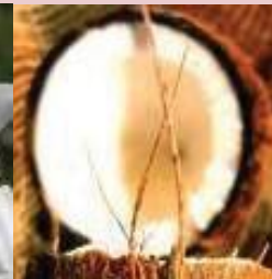
Eau de noix de coco