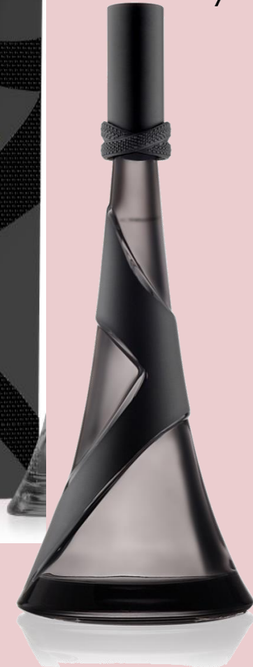
Eau de Parfum Natural Spray + Testeur 100ml