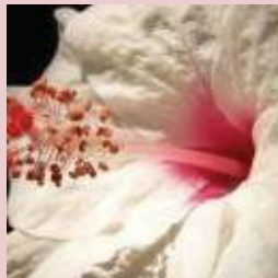
Fleur d'hibiscus hawaïenne