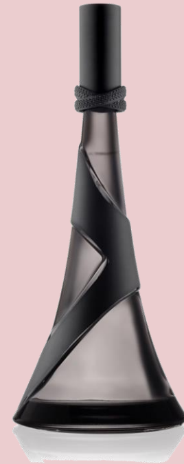
Eau de Parfum Natural Spray 30ml