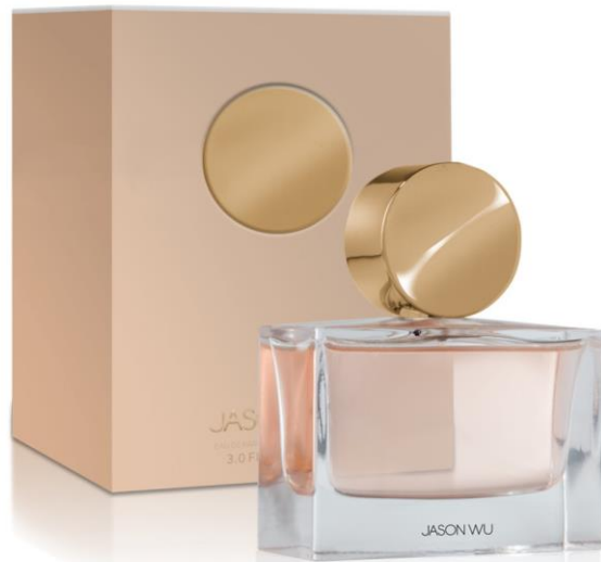
Eau de Parfum 90ml