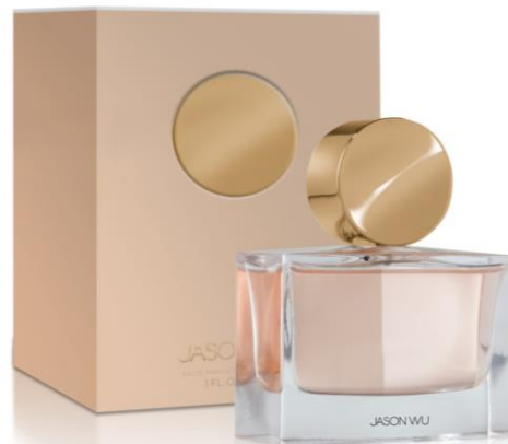
Eau de Parfum 30 ml